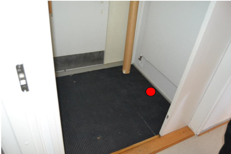
7.Huone 20, tuulikaappi: Seinän vierestä.