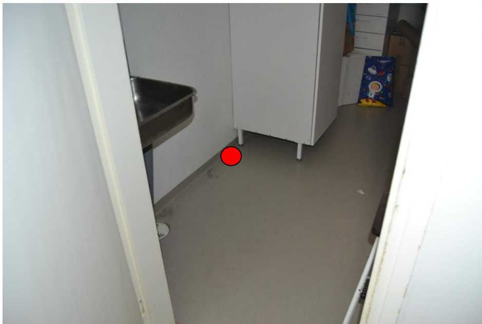
4.Huone 06, siivousvälinevarasto: Huone 08:n viemärin tuuletusputken kohdasta seinän vierestä.