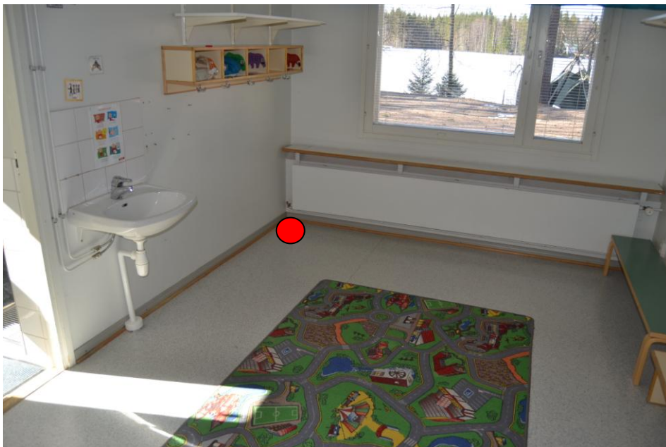
6.Huone 26, eteinen: Vanhan ulkoseinän kulmauksen nurkkaus.