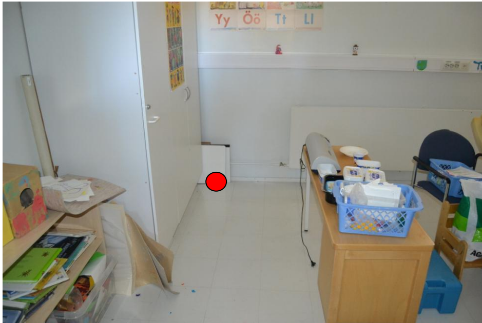
9.Huone 29, pienryhmätila: Ulkoseinän ja huone 30:n välisen seinän nurkkauksessa olevien kaappien eteen seinän viereen.