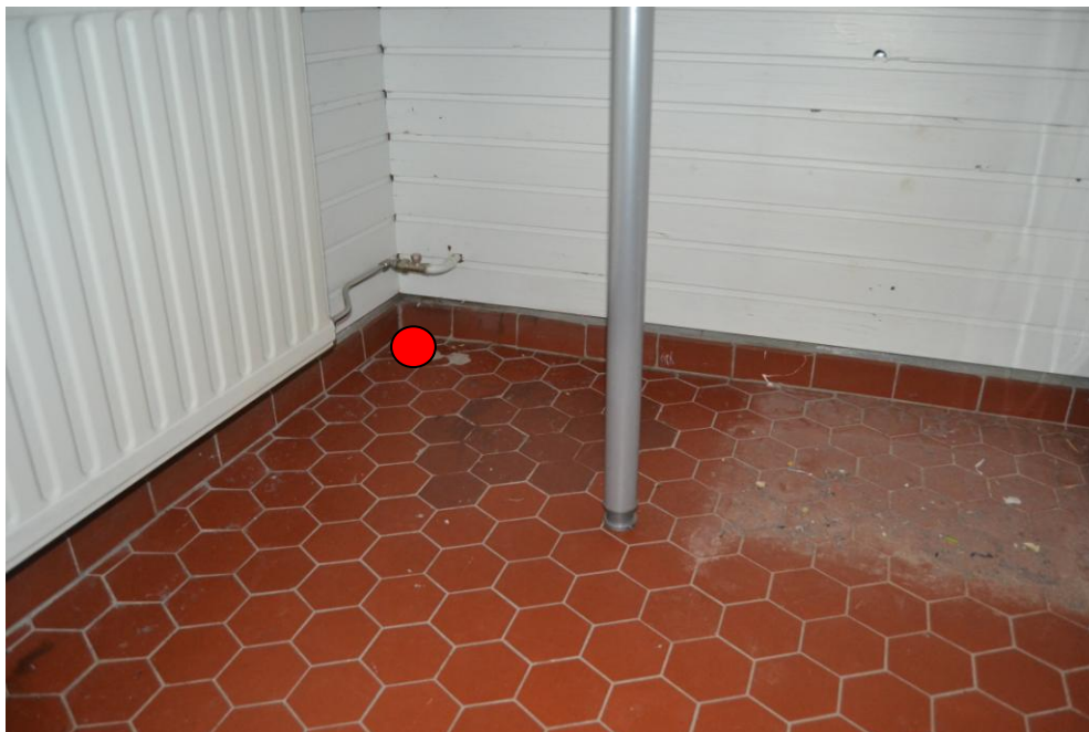
2.Huone 11, pyykinkäsittelyhuone: Ulkoseinän ja huone 6:n välinen nurkkaus.