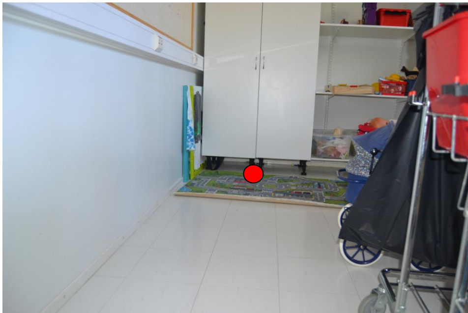
8.Huone 28, pienryhmätila: Kaapiston alapuolelle (vanha viemärin tulpattu pää).