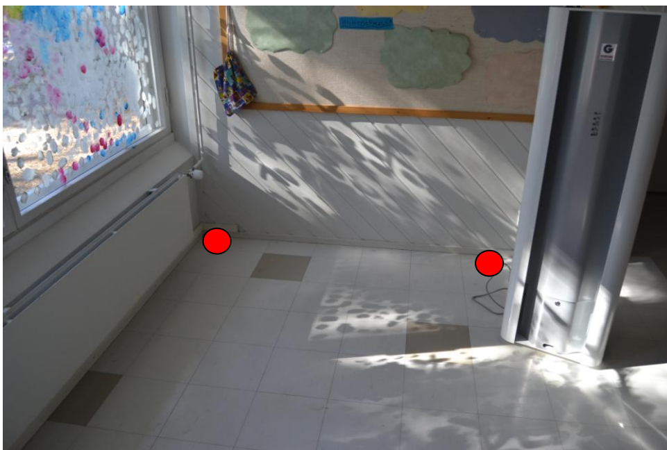
10.Huone 31, ruokailu/ryhmätila: Ulkoseinän ja huone 30:n välisen seinän nurkkaus ja keskeltä seinää.