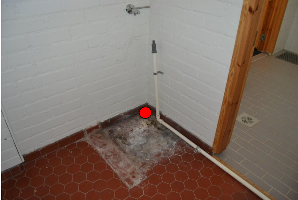
1.Huone 11, pyykinkäsittelyhuone: Hormiston ja huone 10:n välinen nurkkaus.