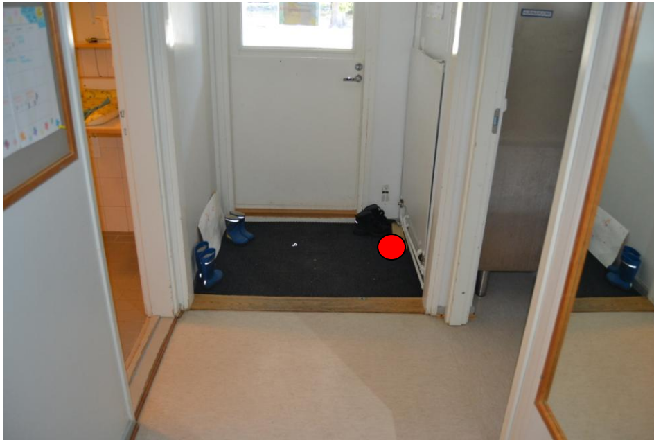
5.Huone 01, tuulikaappi: Seinän vierestä.